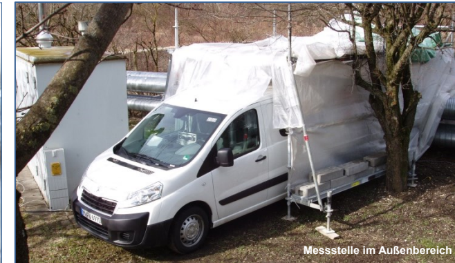
Messstelle im Außenbereich