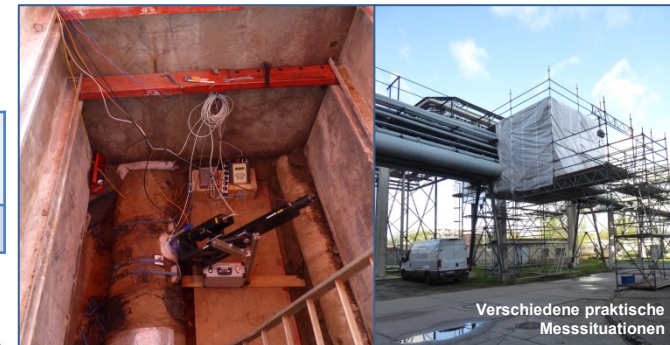
Verschiedene praktische Messsituationen

Bis Ende des Jahres 2024 wurden mehr als 220 Vor-Ort-Kalibrierungen von Durchfluss-Messgeräten in Fernwärme- und Trinkwasser-Leitungen durchgeführt. Ca. ein Fünftel der kalibrierten Geräte wiesen beträchtliche oder hohe Abweichungen auf. Dies zeigt deutlich die Notwendigkeit und den Nutzen von Vor-Ort-Kalibrierungen von Durchfluss-Messgeräten auf.