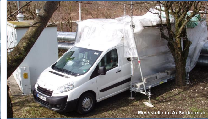
Messstelle im Außenbereich