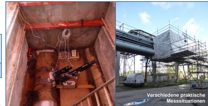
Verschiedene praktische Messsituationen

Bis Ende des Jahres 2023 wurden mehr als 210 Vor-Ort-Kalibrierungen von Durchfluss-Messgeräten in Fernwärme- und Trinkwasser-Leitungen durchgeführt. Ca. ein Fünftel der kalibrierten Geräte wiesen beträchtliche oder hohe Abweichungen auf. Dies zeigt deutlich die Notwendigkeit und den Nutzen von Vor-Ort-Kalibrierungen von Durchfluss-Messgeräten auf.